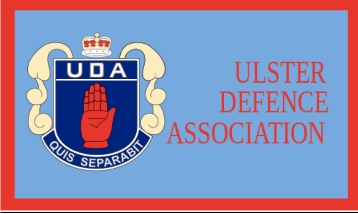
Ulster Savunma Birliği

ABD, 2002 yılında bu örgütü terör örgütleri listesinden çıkarmıştır. Fakat 2009 yılında bir düzenleme ile eski IRA ve devam eden IRA listeye tekrar eklenmiştir. Avrupa Birliği'nde, Birleşik Krallık'ta ve İrlanda'da yasa dışı terörist organizasyon olarak kabul edilmektedir.